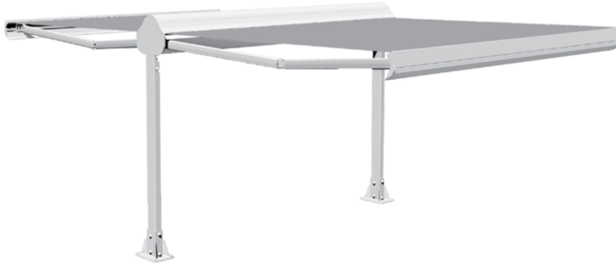
Diagramma di copertura - Covering diagram